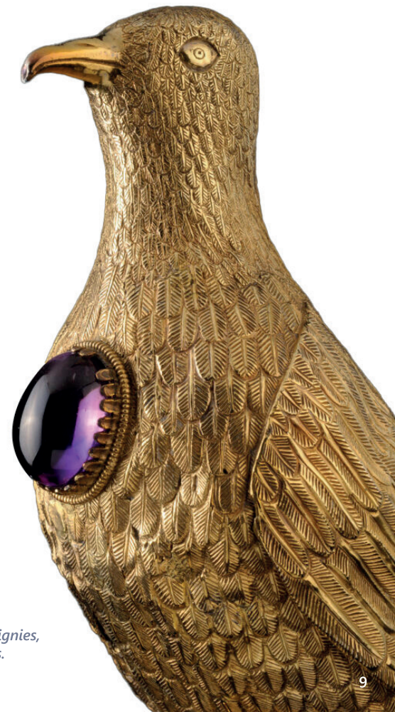
Der Schatz von Hugo von Oignies, eines der 7 Wunder Belgiens.