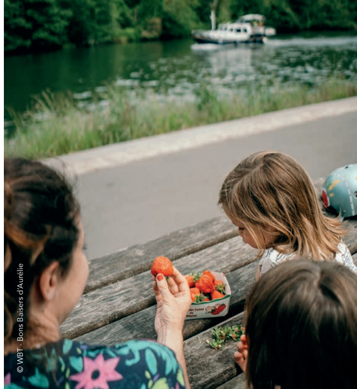
© WBT - Bons Baisers d'Aurélié