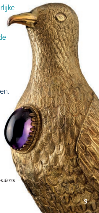
De kerkschat van Oignies een van de 7 Belgische wonderen