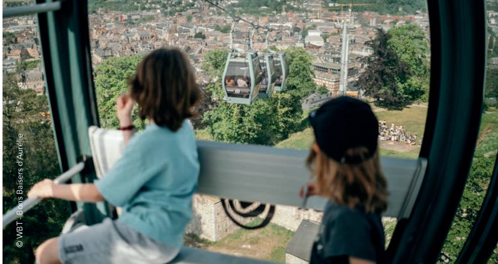
© WBT - Bons Baisers d'Auréliette